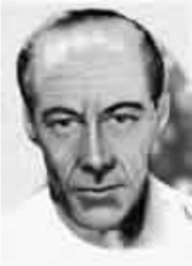
Publius Pontius Pilatus