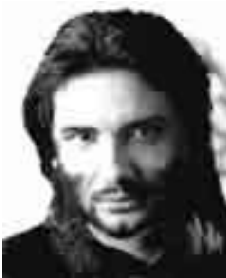
Simon le Zélote