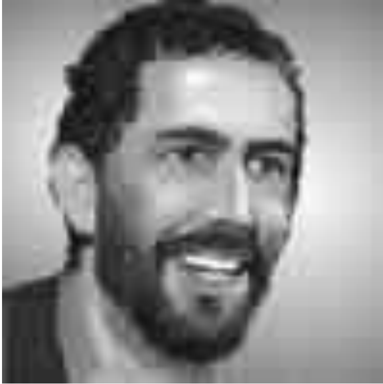
Joseph, le père de Jésus

Bien sûr, d'un point de vue spirituel, rien de tout cela est important. Par contre, comme un exemple des problèmes de médiumnité, c'est très important et cela a contrarié de nombreuses personnes. Cependant il serait absurde d'en déduire qu'aucune canalisation est sans erreur. C'est simplement que beaucoup trop de gens l'ont ainsi interprétée, en considérant la Bible comme leur source parfaite et sont devenus excessivement contrariés par le constat qu'une source spirituelle privilégiée n'était peut-être pas aussi parfaite qu'ils le pensaient. Nous reviendrons ultérieurement sur ce sujet, d'autant plus que Judas lui-même fut questionné à ce sujet et a donné une réponse détaillée.