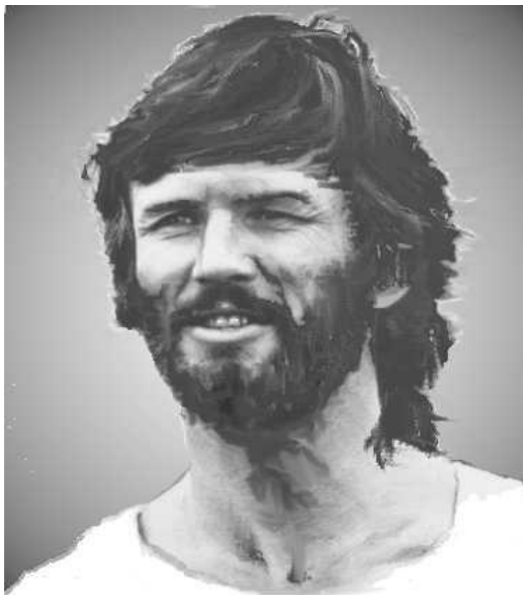
Judas de Kérioth

Maintenant, alors que je suis sur le point de te quitter, je tiens à te dire que j'aime bien la façon dont tu as dessiné mon portrait. J'étais un peu plus mince, mais c'est une bonne image. Merci. Tu as également reçu une vision d'André. Peut-être pourras-tu, un jour, peindre une galerie de portraits de tous les apôtres 13 ? Ce serait certainement très attrayant.